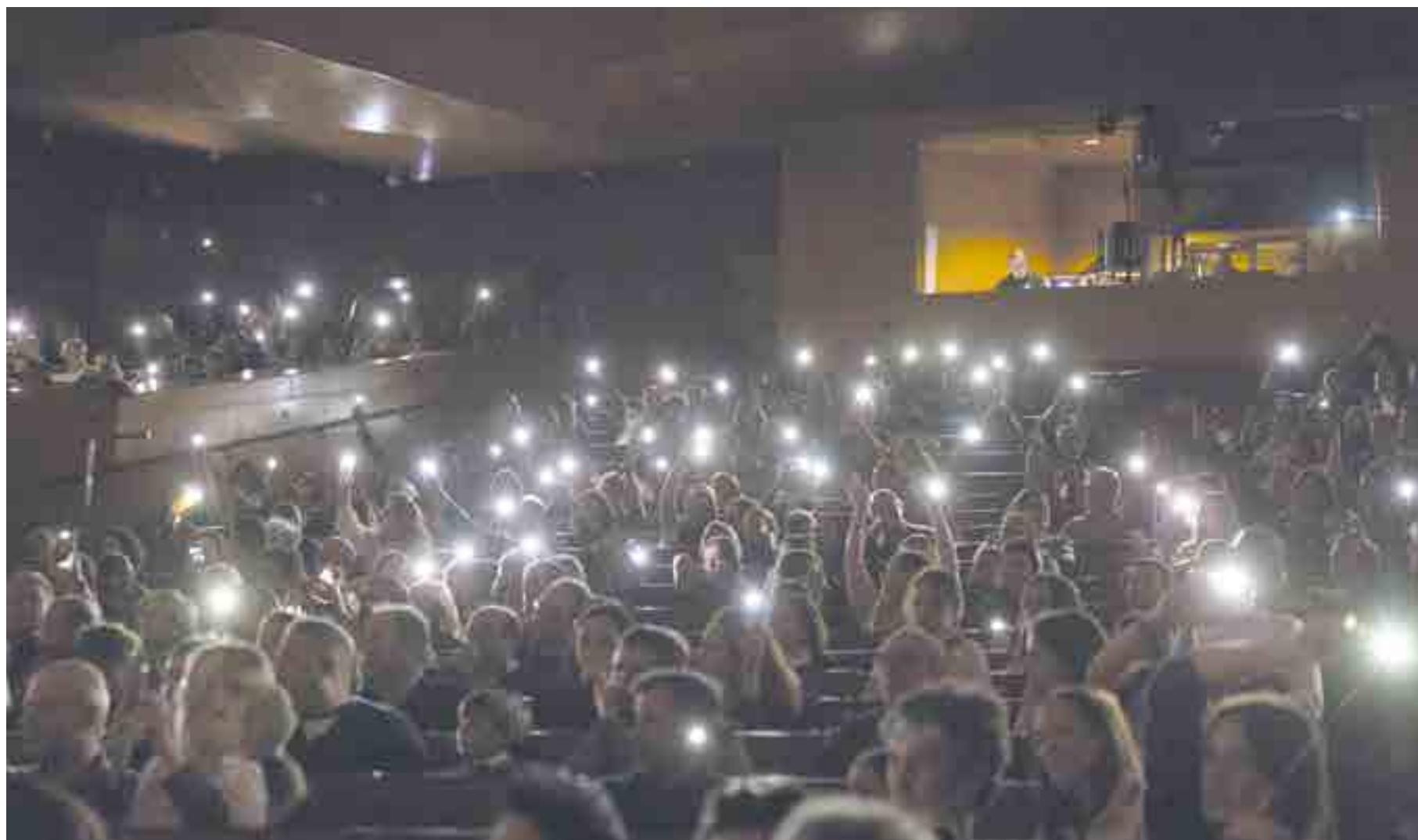
Las familias estaban entregadas a las actuaciones e incluso colaboraban a remediar el apagón