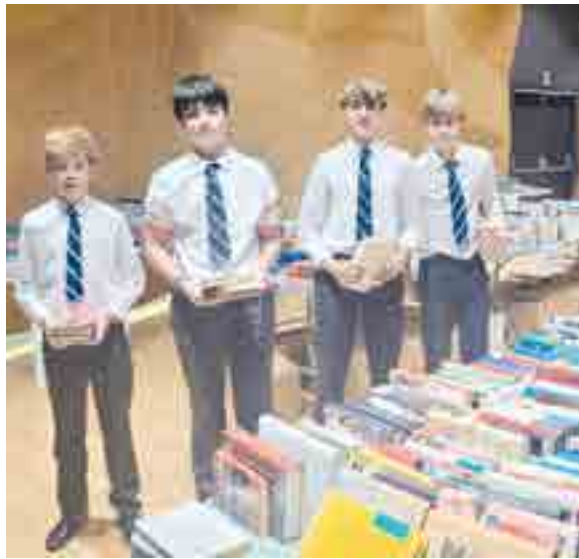
Nuestros alumnos colaboraron en la disposición de los stands, la venta y recaudación de la venta de libros donados