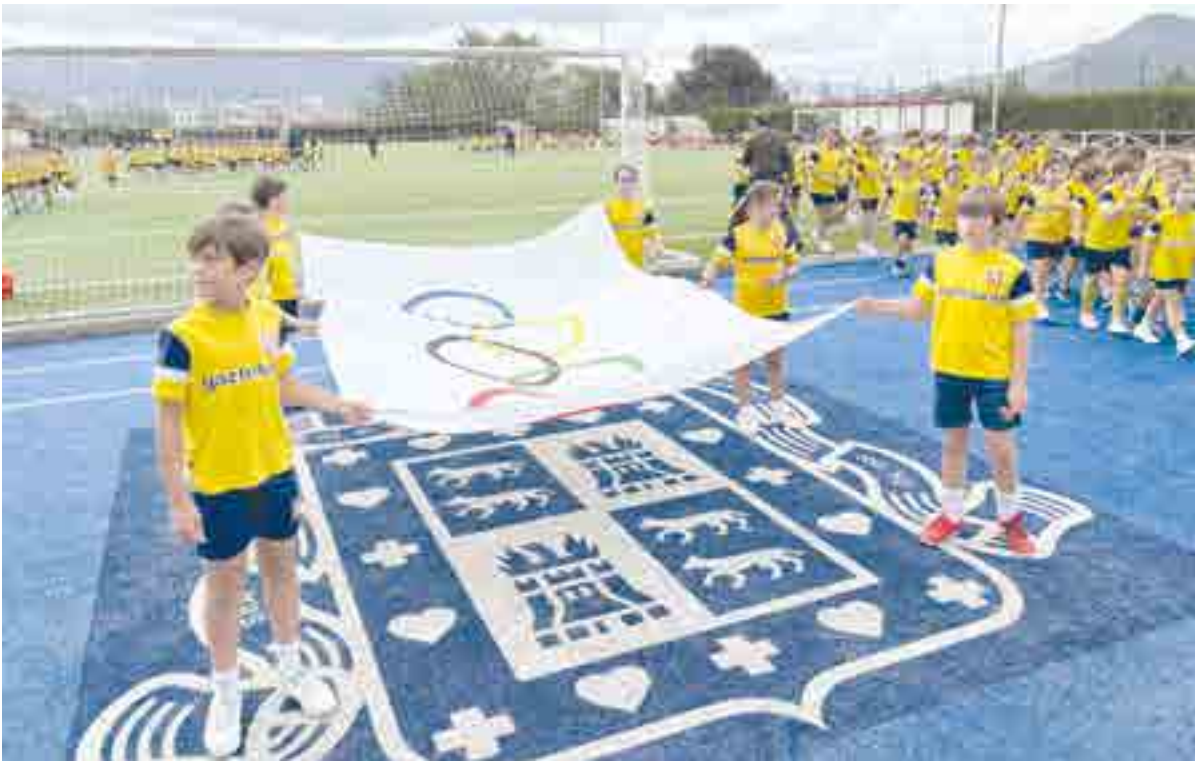
Alumnos de PEP 7 a PEP 9 portaron la bandera olímpica hasta su izado en el mástil del colegio