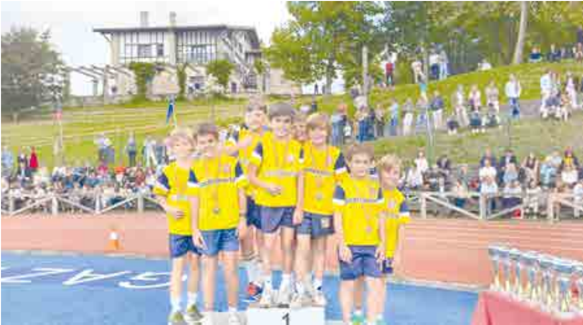
¡Los ganadores del cross de PEP 7 no cabían en el podio!