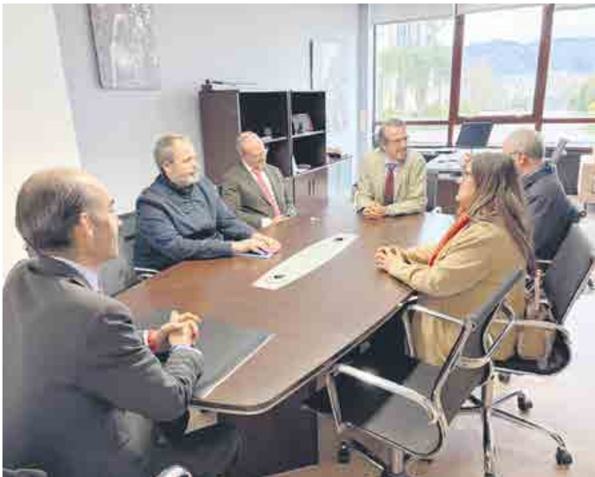
Los equipos directivos de ambos centros compartiendo una jornada de trabajo sobre el proyecto educativo del colegio

Siempre es un placer compartir nuestra experiencia y ofrecer una mirada abierta sobre el trabajo que realizamos cada día en Gaztelueta, así como aprender de las perspectivas que aportan otros profesionales de la educación. En Gaztelueta mantenemos siempre nuestras puertas abiertas a quienes desean conocer de cerca nuestro proyecto educativo.