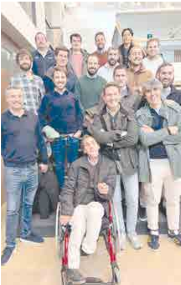
Promoción 48º de 2005