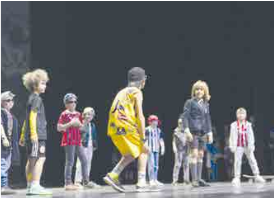
Unos pandilleros aconsejan a un alumno de PEP 7 sobre su futuro en el marco de la historia de un apagón