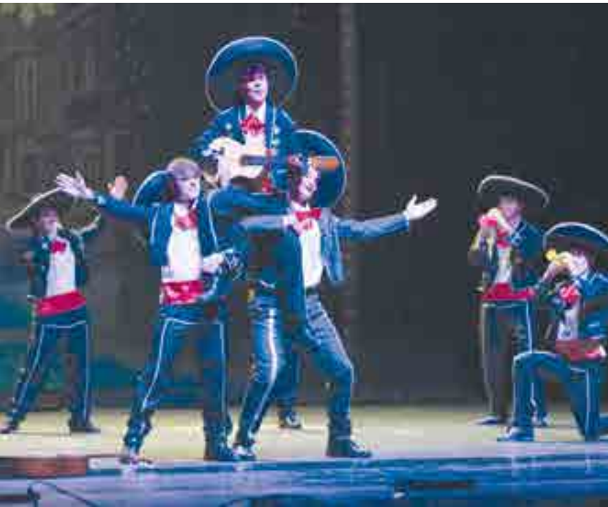
Mariachis de Bachillerato cerraron la actuación