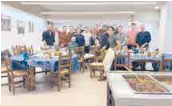
Promoción 48º de 2005