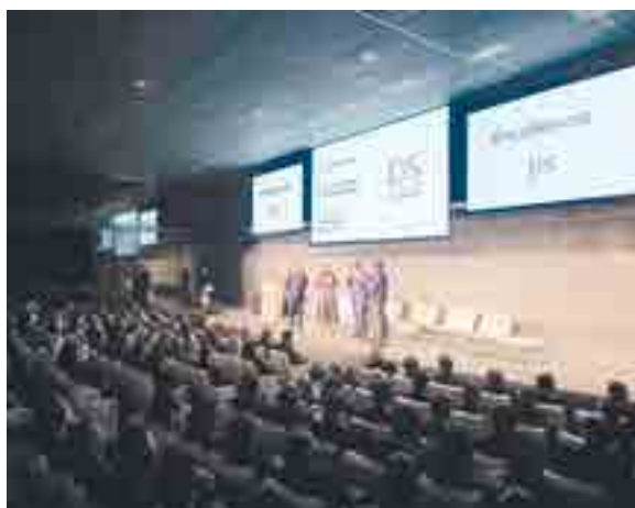
El acto tuvo lugar en el auditorio Rafael del Pino, en Madrid

Para Gaztelueta, la obtención del primer premio "Derecho y Tú" es un motivo de orgullo institucional y un estímulo para seguir promoviendo una educación que una excelencia académica, desarrollo personal y responsabilidad social. La privacidad digital seguirá siendo