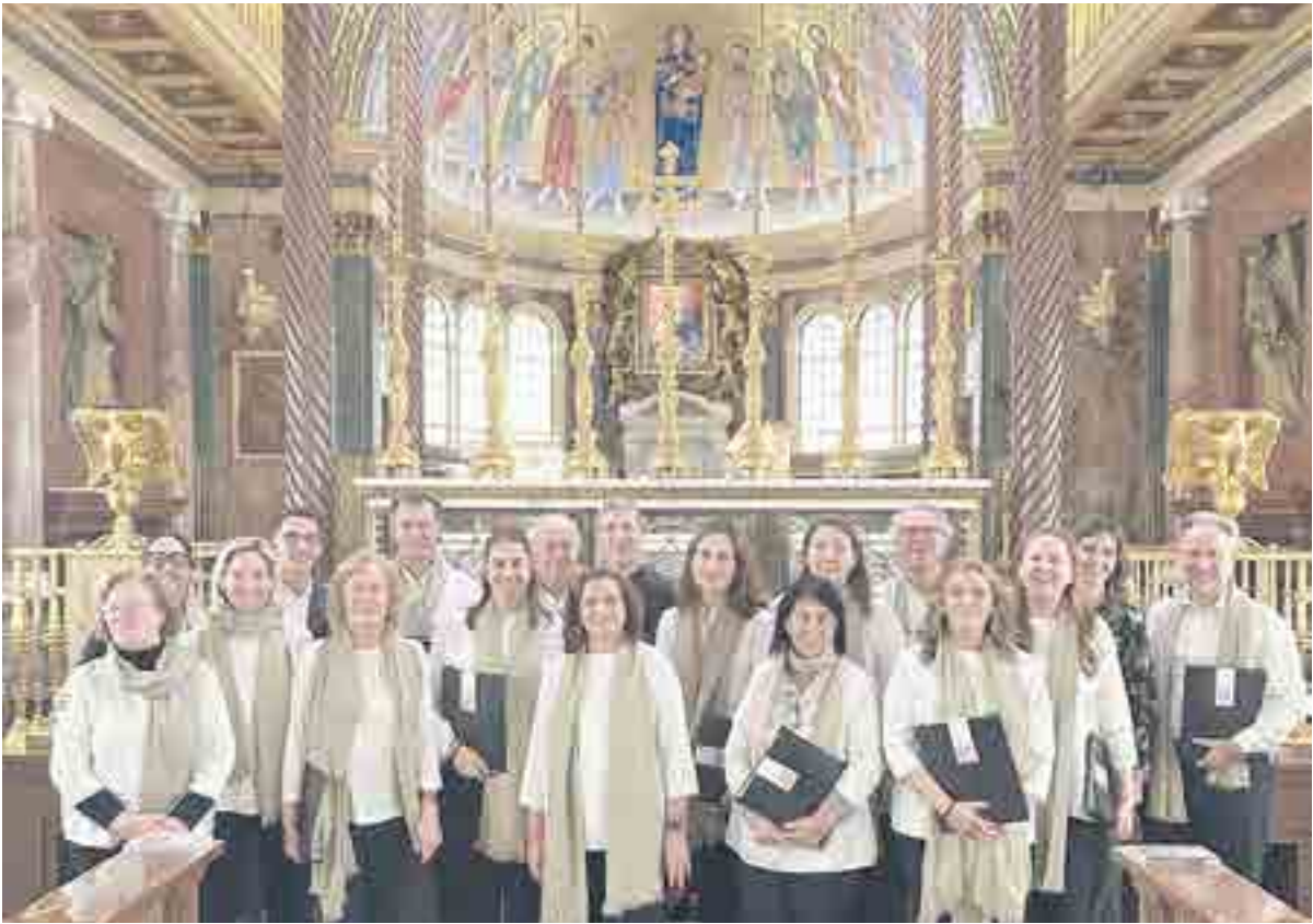
El coro del colegio, en Villa Tevere