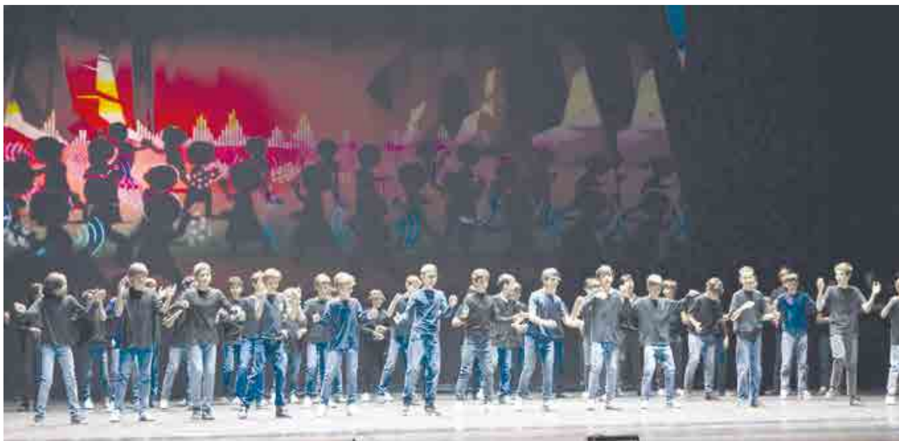
Alumnos del PAI realizando una coreografía moderna