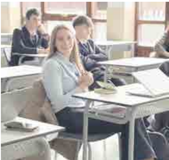
STARTInnova cuenta con emprendedores que ponen su experiencia al servicio del aprendizaje de los estudiantes

to, como El Diario Montañés (Cantabria), El Diario La Rioja, y El Norte de Castilla (Castilla y León), con el apoyo de entidades como el Gobierno Vasco, el Ayuntamiento de Bilbao y el CISE (Centro Internacional Santander Emprendimiento) en diferentes regiones.