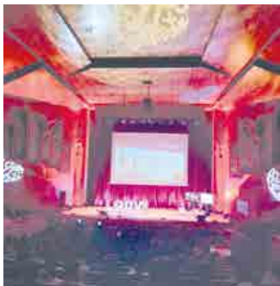
Más de 2000 jóvenes acudieron al encuentro