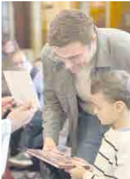
Los alumnos de año 1 de catequesis recibieron simbólicamente el catecismo infantil de manos de sus familias