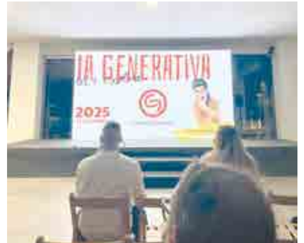
En su sesión, Guerra expuso cómo la IA está revolucionando los distintos sectores