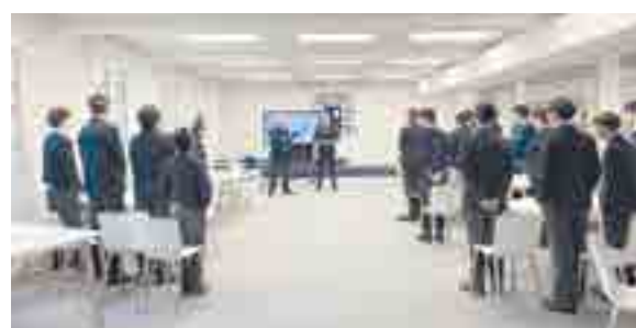
4º de ESO también tuvo la oportunidad de participar en una charla específica con él sobre futuro laboral y salidas profesionales en el ámbito de la aviación