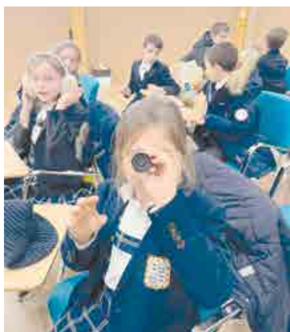
En la ONCE descubrieron cómo son los materiales adaptados, las formas de comunicación y los recursos que favorecen la autonomía y la inclusión

Fue una visita muy enriquecedora que ayuda a construir una mirada más sensible y comprometida con los demás.