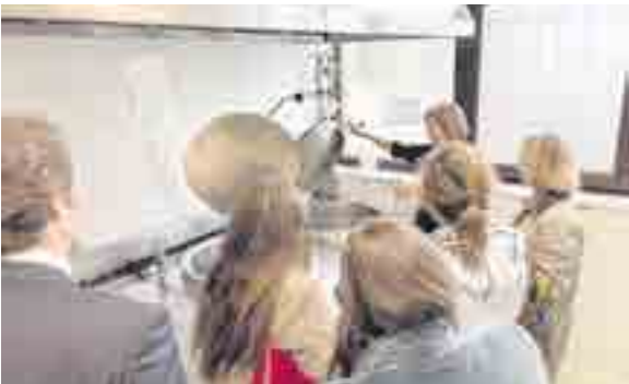
El proyecto comenzó el curso pasado con el objetivo de fomentar en vuestros hijos hábitos de alimentación sanos, responsables y sostenibles

Además, aquellas familias que quisieron pudieron comprobar de primera mano cómo es comer en el colegio, en las mismas condiciones en las que los alumnos lo hacen cada día.