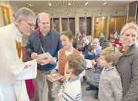
Los alumnos de año 2 reciben de un familiar los diez mandamientos de la ley de Dios

en el colegio. Han sido numerosas familias las que han acogido la misión de ser ellas mismas las catequistas de año 1 y 2 dos viernes al mes en horario escolar. Este mes de noviembre hemos celebrado las misas de inauguración del curso de catequesis. En el transcurso de la misa catequética, los alumnos apuntados a la catequesis de año 1 recibieron de sus familias el catecismo infantil. A los alumnos de año 2 y sus familias, se les hizo la entrega simbólica de los Mandamientos de la Ley de Dios. Por último, a los de año 3 se les hizo entrega simbólica de las Bienaventuranzas.