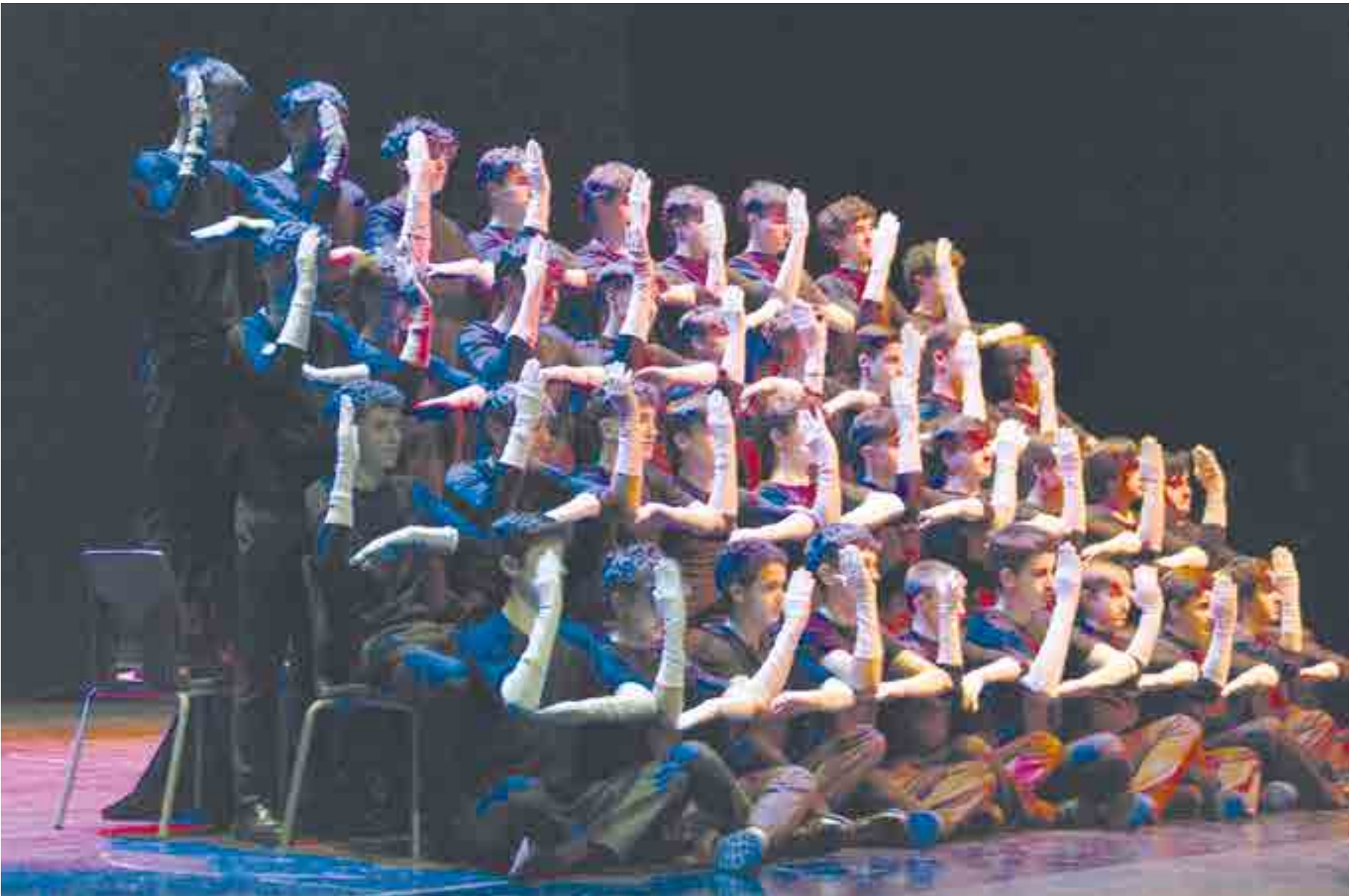
Un número muy visual, uno de los mejores y más originales de la noche