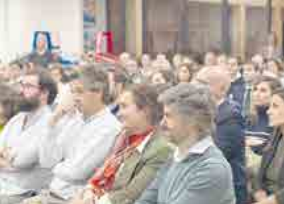
La labor de los MEC, puente entre las familias y Gaztelueta facilitando la comunicación, el acompañamiento y el buen funcionamiento de cada curso, es fundamental