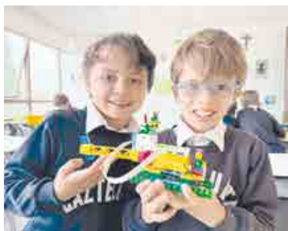
Nuestros alumnos disfrutan mucho mientras aprenden