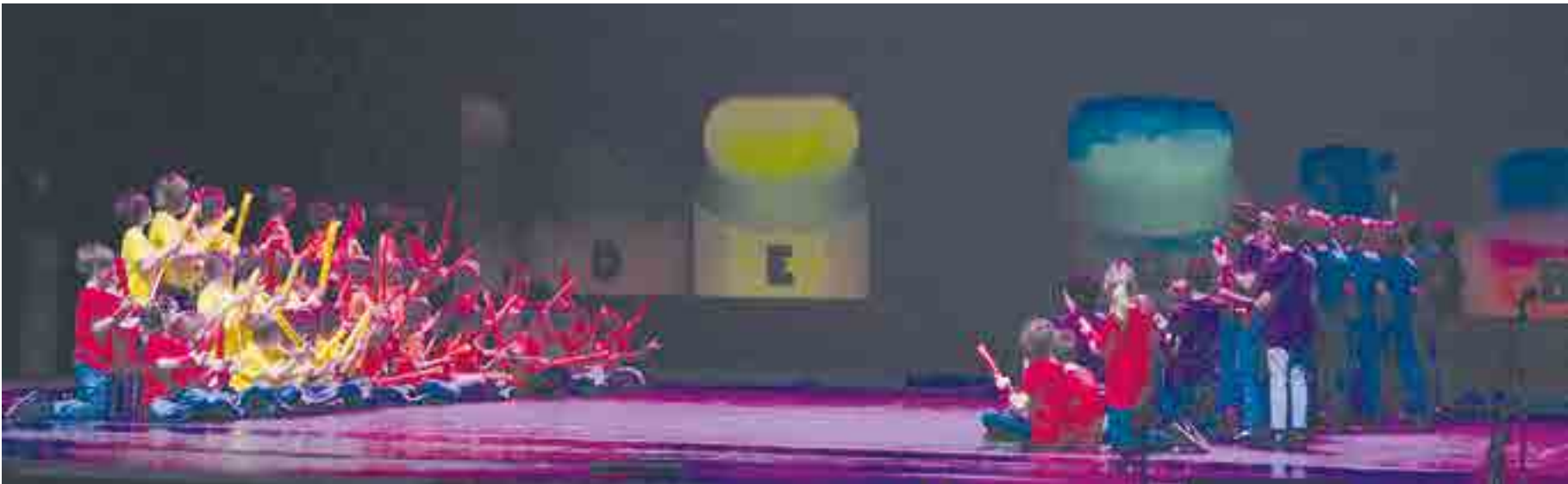
Número de percusión guiada de PEP 6