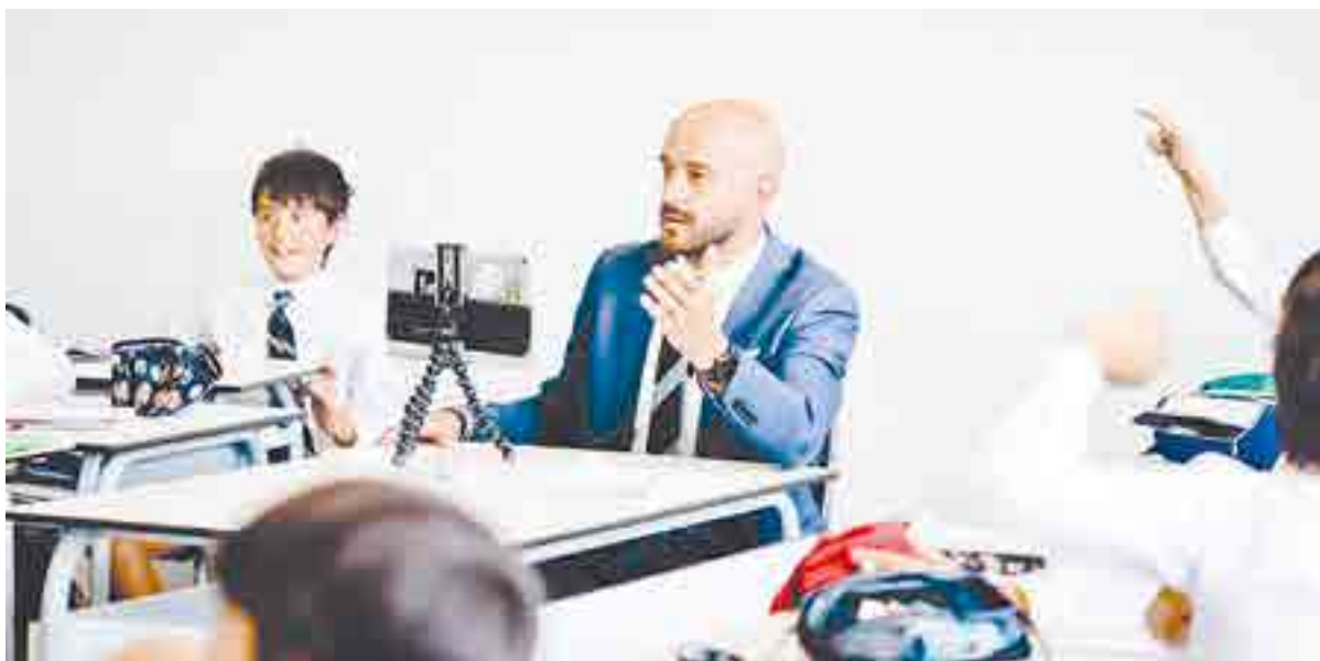
La vocación de maestro es por tanto una forma de amar. Amar lo que uno enseña, pero sobre todo amar a quien lo aprende