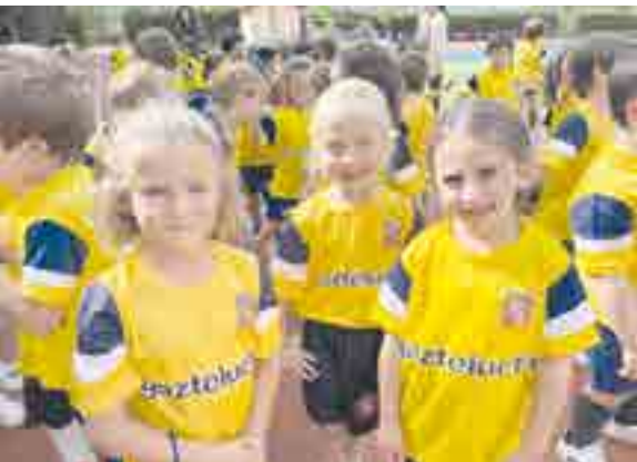
Alumnas de PEP 4 (1º EP) con muchos nervios en su primera Olimpiada