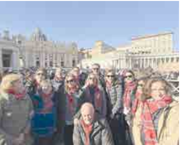
El grupo vivió cerca del papa este acontecimiento histórico y disfrutó durante unos días de la ciudad eterna

Nuestro coro de padres y madres, acompañados de sus familiares, acudieron también a la cita en grupo y aprovecharon para vivir este momento histórico y para ver la y disfrutar la ciudad. Pudieron cantar en Villa Tevere, sede de la Prelatura, San Eugenio y en la misma basílica de San Pedro.