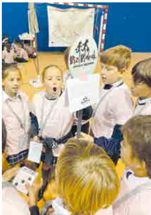
A través de dinámicas participativas y adaptadas a su edad, los alumnos reflexionaron sobre cómo pequeños gestos cotidianos pueden tener un gran impacto

nidad para que los niños aprendan, de manera práctica y cercana, que ellos también pueden ser protagonistas del cuidado del entorno y de la mejora de la vida en la comunidad.