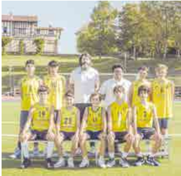
Equipo Infantil y Cadete de baloncesto