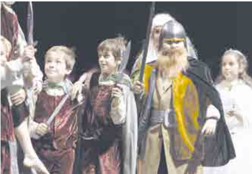
Hobbits de la Comarca en acción