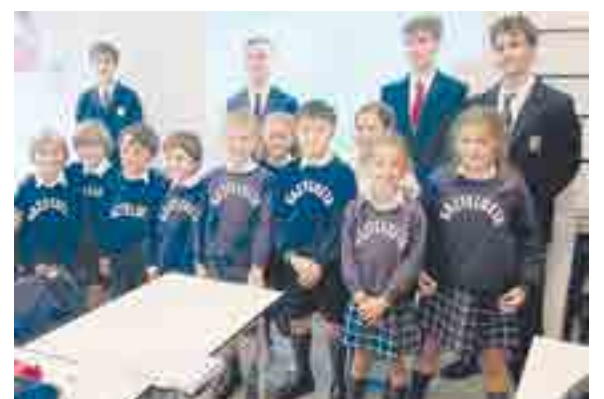
Su estancia estuvo repleta de visitas, sesiones, turismo y deporte