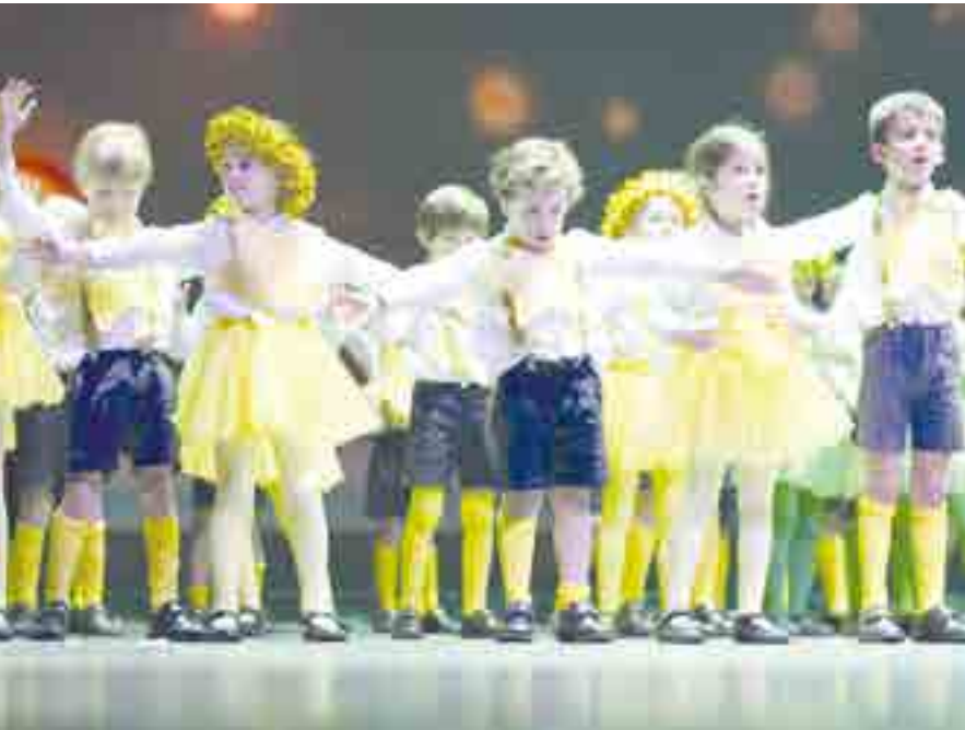
Alumnos de PEP 4 disfrazados de estrellas en un espectáculo muy vistoso