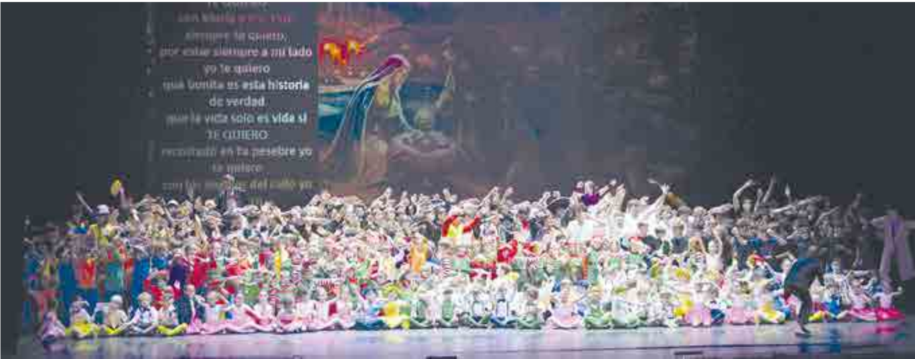
Al final del festival todos los actores y actrices salen al escenario a cantar el villancico del colegio y despedirse del público

y niñas de Primaria, coreografías al ritmo de la música que anunciaban la inminencia del año del 75º aniversario del colegio... Un gran show de luces y actuaciones preparadas con cariño y esfuerzo por profesores y alumnos, y que entretuvieron e hicieron disfrutar mucho al público.