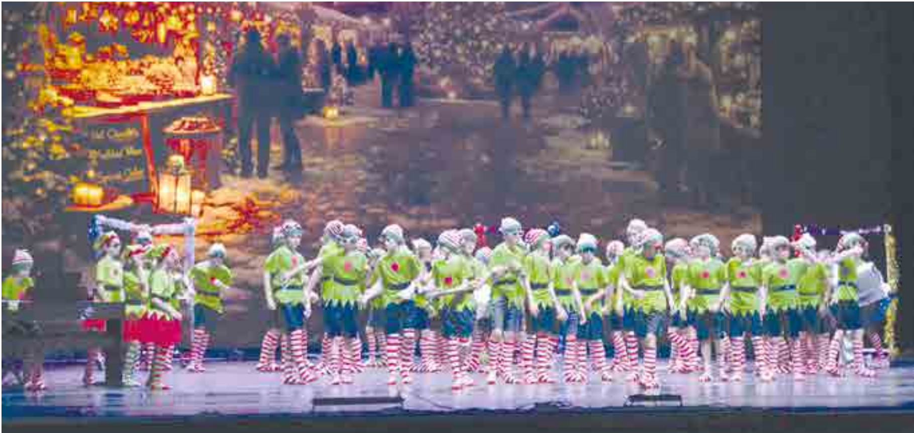
Duendes de PEP 9 en su actuación