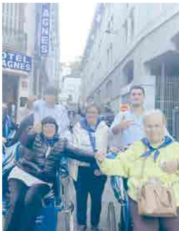
Los alumnos participaron como voluntarios, colaborando en la atención y acompañamiento de las personas enfermas, compartiendo con ellas momentos de servicio, oración y convivencia

za en nuestros alumnos el valor del servicio a los demás como camino de crecimiento personal y cristiano.