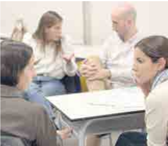
Tras la introducción del director, tuvieron lugar talleres de trabajo sobre aspectos a mejorar del colegio