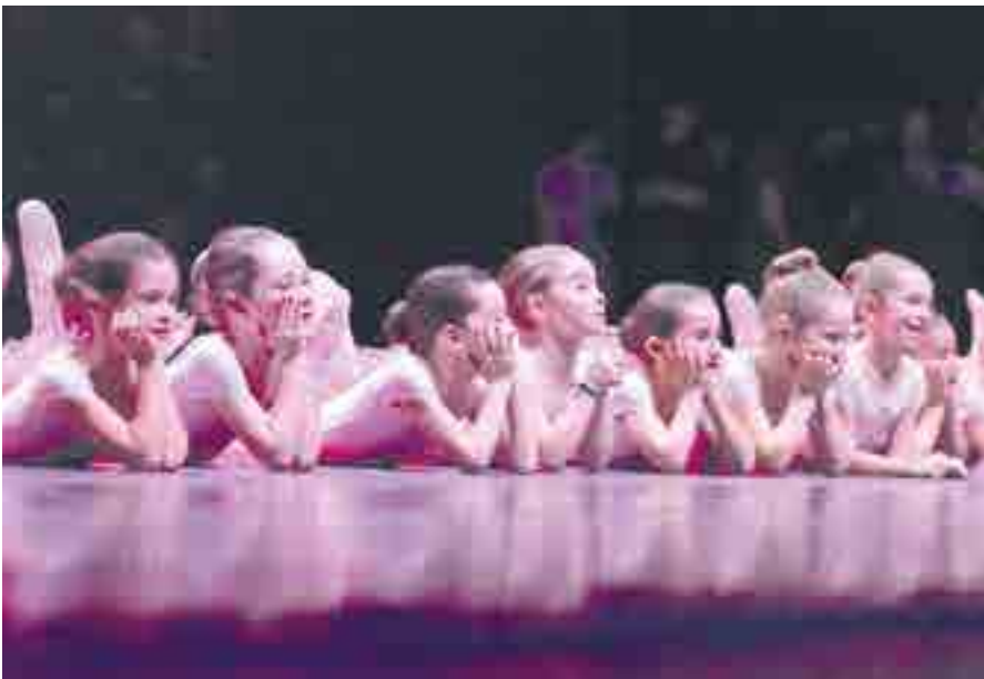
Las pequeñas bailarinas de ballet en su actuación, ¡qué valientes!