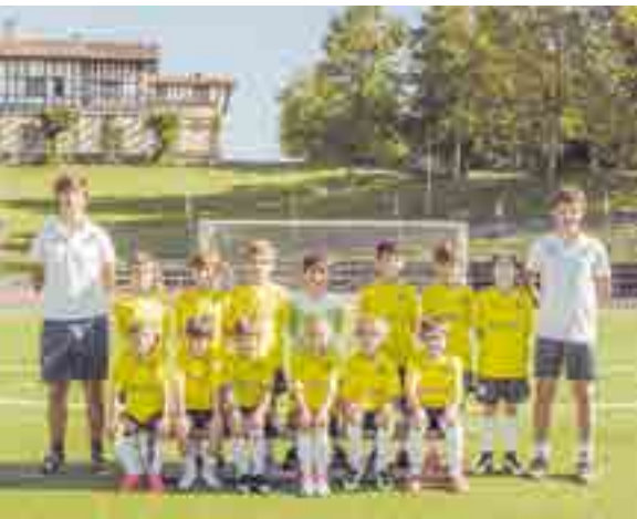
Equipos de fútbol benjamines 2018