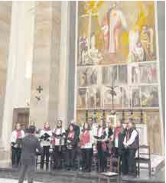
Cantando en la basílica de San Eugenio