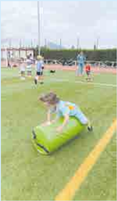
La potencia y la valentía son muy importantes en este deporte

En octubre se celebró en el colegio otra jornada de promoción del rugby entre los más jóvenes de Gaztelueta. En ella, y mediante sencillos ejercicios de iniciación, se procura que familias y alumnos descubran un deporte algo menos popular en España pero con una interesante cultura de valores éticos (disciplina, la solidaridad, la integridad o el respeto) y habilidades físicas y mentales (potencia, concentración, liderazgo, valentía).