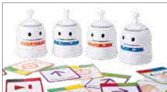
Los robots True True sirven para iniciarse en el lenguaje de la programación

Este curso, aquellos alumnos desde PEP 4 a PEP 7 (1º a 4º de Primaria) inscritos en la actividad extraescolar de robótica, tienen la oportunidad, siguiendo una progresión didáctica pensada para aprender desde cero, de iniciarse en lenguaje de programación utilizando los robots True True o programar videojuegos con Scratch . Además, los alumnos, tras un tiempo son capaces de imaginar, diseñar y programar sus propios robots con Lego Education .