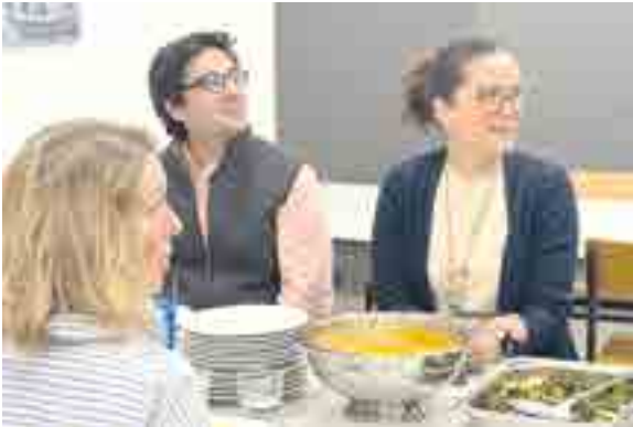
Las familias pudieron comprobar cómo es comer en el colegio, en las mismas condiciones en las que los alumnos lo hacen cada día

Esta propuesta forma parte del compromiso que adquirimos con vosotros desde el inicio del curso, reflejado en nuestra Guía de Estilo , y busca que nuestros alumnos no solo coman abundante y bien, sino que además disfruten de la comida y comprendan la importancia de una buena alimentación como parte fundamental de su desarrollo personal y académico.