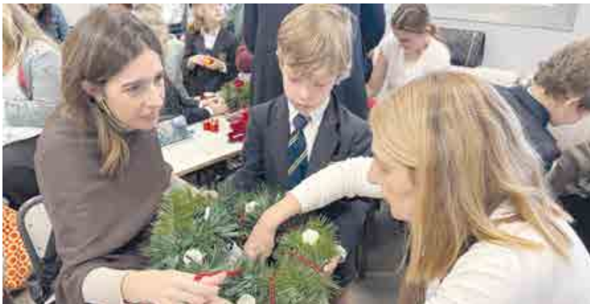
Familias y alumnos manos a la obra para crear uno de los primeros símbolos que nos prepara para la llegada de la Navidad, las coronas de Adviento

Entre risas, colores, ramas y la ilusión propia de estas fechas, se dio el pistoletazo de salida a este tiempo tan especial. Gracias a todas las familias por compartir este momento con nosotros y por hacer que cada año el ambiente navideño empiece con tanta alegría y cariño.