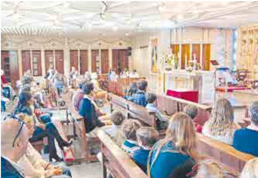
En noviembre se celebraron las misas inaugurales de catequesis en año 1, 2 y 3 (PEP 5 a PEP 7)