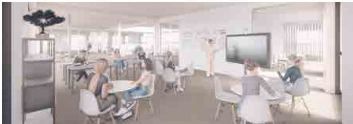
Los espacios de aprendizaje serán modernos y funcionales

Reproducción virtual del proyecto que dará comienzo en pocas semanas