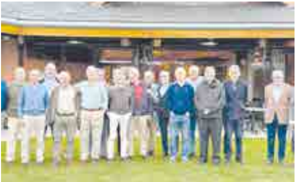
Promoción 16º de 1972