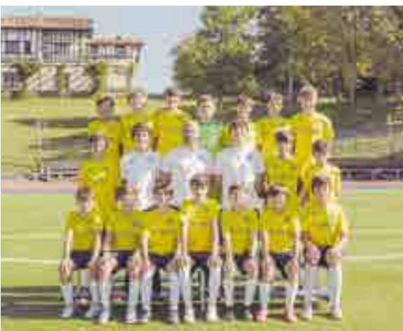
Equipo Infantil de fútbol