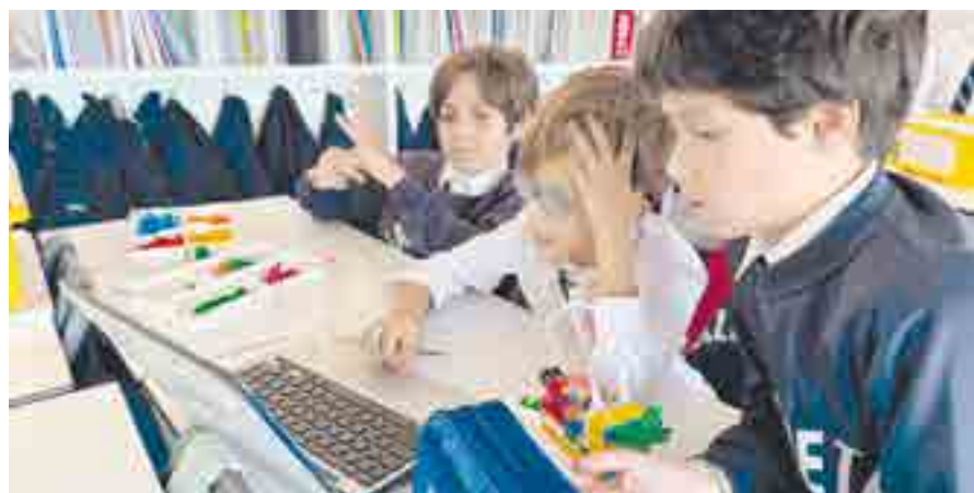
Los alumnos desarrollan su pensamiento computacional, su creatividad y habilidades de resolución de problemas