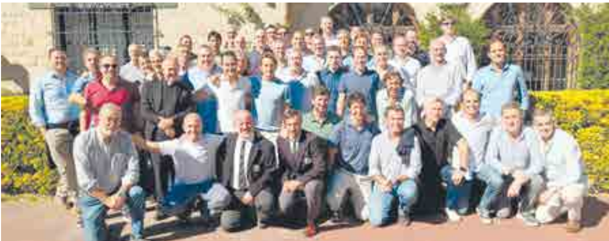
Promoción 38º de 1995 junto a algunos profesores