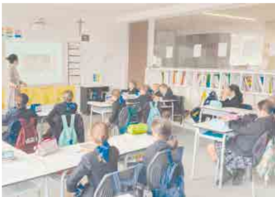
Expertos del programa Aprendamos a Amar (Universidad Francisco de Vitoria) ofrecen formación a familias y centros educativos