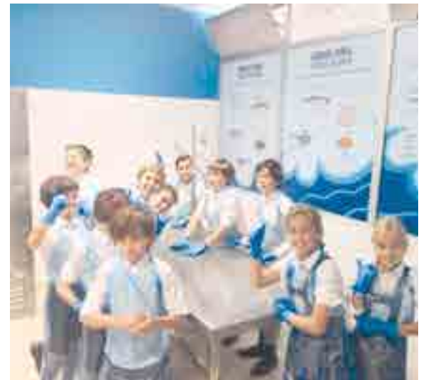
La visita se enmarca dentro de la metodología del Bachillerato Internacional, que fomenta el aprendizaje basado en la indagación, la comprensión conceptual y la acción