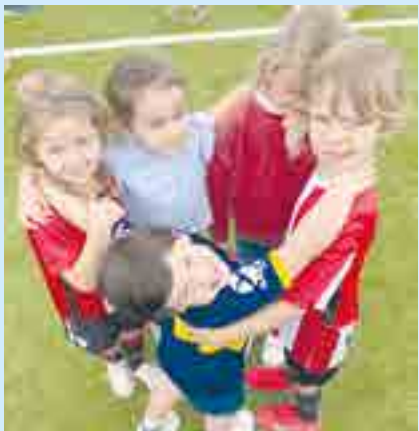
La jornada es una oportunidad divertida para los más pequeños del colegio