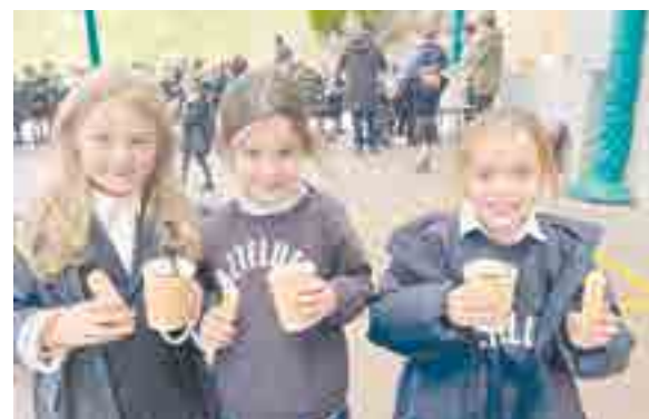
Para terminar y combatir el frío de diciembre, se organizó una chocolatada