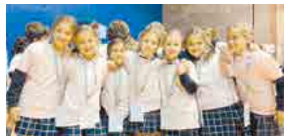
El proyecto constituye una oportunidad para que los niños aprendan que ellos también pueden ser protagonistas del cuidado del entorno