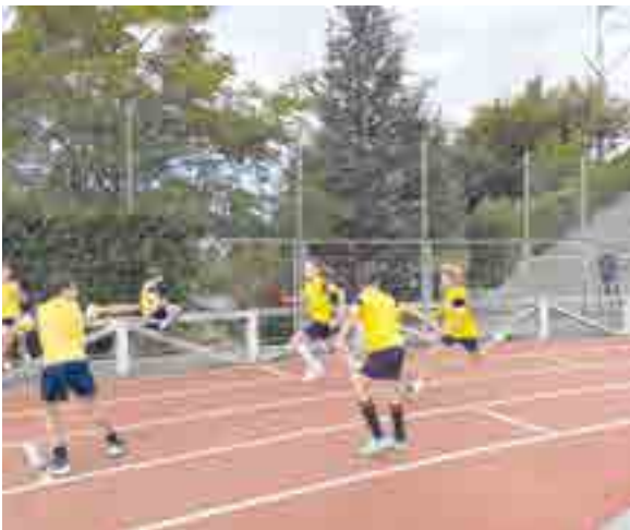
Los alumnos de PEP 8 (5º de EP) en plenos relevos