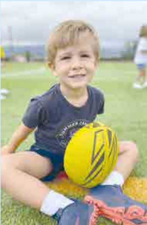
El rugby promueve valores como el respeto y el liderazgo