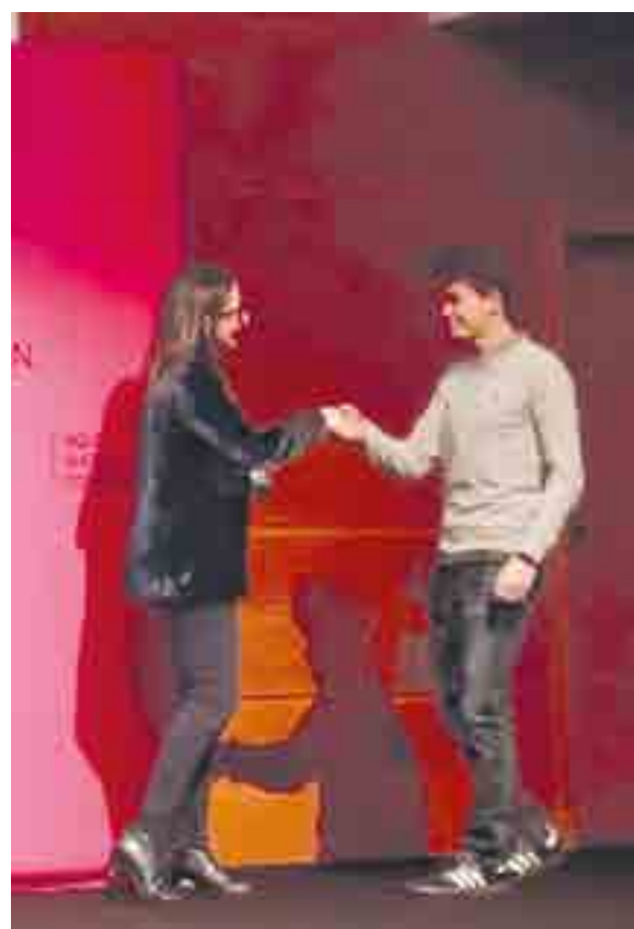
El acto estuvo presidido por la Consejera de Educación del Gobierno Vasco, Begoña Pedrosa, con la que tuvieron oportunidad de hablar al final del acto