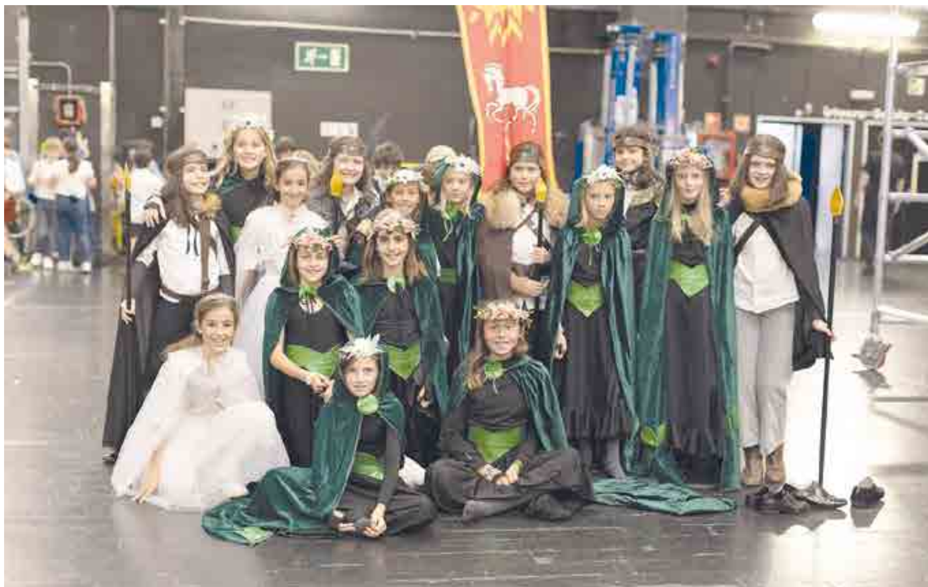
Elfas de PEP 8 en el backstage