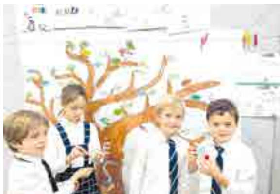
Los alumnos participaron de actividades y talleres por la mañana, en los que profundizaron en la cultura y mitología vasca

Por la tarde, se organizaron juegos tradicionales vascos en los que la fuerza, la coordinación y la rapidez son claves. Para terminar y combatir el frío de diciembre, se organizó una chocolatada que los alumnos y sus profesores disfrutaron mucho.