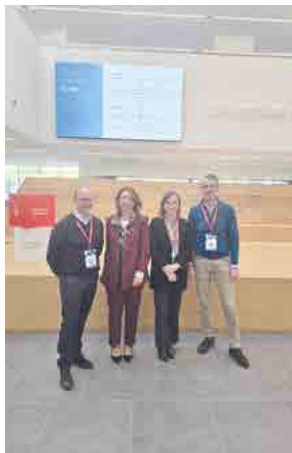
Imagen del Simposio