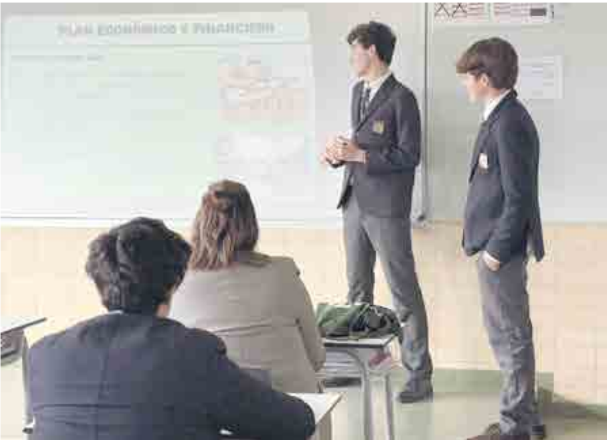
Formarte, tener una idea, desarrollarla y defenderla son las fases del programa