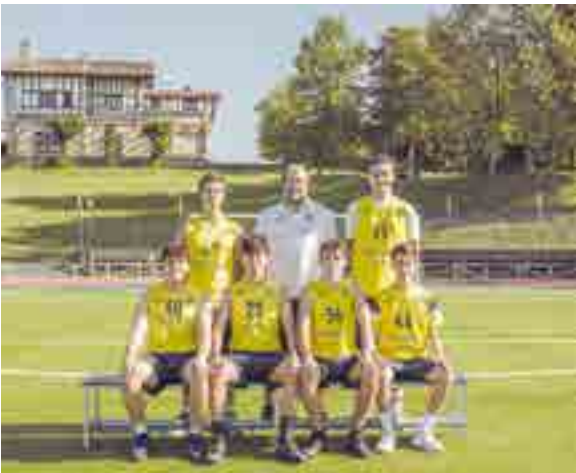
Equipo Juvenil de baloncesto